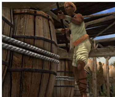
تصویر ۶. ورود قهرمان و یارانش در انبار مهمات دشمن در منطقه زندگی قهرمان