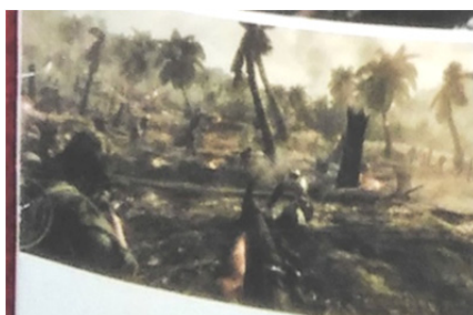
تصویر ۸- درگیری در منطقه‌ی دشمن.

قهرمان با عبور از موانعی که دشمن بر سر راه آن‌ها قرار داده است؛ و پا پس نکشیدن از مبارزه تا پیروزی و پیشروی در منطقه دشمن در مناطق جنگی و با حمله‌هایی در (خشکی، هوایی و دریایی) که میان مردان ارتش آمریکا و دیگر کشورهای درگیر جنگ اتفاق می‌افتد همچنان به مافوقش وفادار است. او در ادامه‌ی بخش‌های دیگر بازی به‌عنوان پدیرنکوف حضور دارد و این‌بار همراه روسی‌اش او را راهنمایی می‌کند. او همه‌ی دشمنان را از سر راه بر می‌دارد و این آزمون را که فصل دوم سفر قهرمان است با پیروزی به اتمام می‌رساند؛ بازی کاملاً در دنیای مردانه است و هیچ وسوسه‌ی زنانه‌ای وجود ندارد تا قهرمان را از ادامه‌ی مبارزه باز دارد.