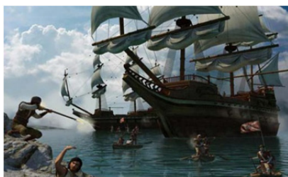
تصویر ۵- قهرمان و یارانش در مقابل کشتی دشمن در منطقه، ماخذ: بازی میرمهنا؛ اخذ شده توسط نگارندگان ۱۴۰۰

منطقه شوند. دوستان شبیر که به‌همراه او زنده مانده‌اند برای حمایت از میرمهنا و دفاع از خاکشان با او همراه می‌شوند. اگرچه اشغالگران خواهر شبیر، حنانه و همسرش سعید را به گروگان گرفته‌اند تا او را از حمایت میرمهنا باز دارند اما او دعوت دشمن را نمی‌پذیرد و به‌سوی مکان خواسته شده، یعنی جایی که میرمهنا در انتظار اوست می‌رود تا با همراهی دیگر جوانان آبادی و رهبرشان میرمهنا اشغالگران را بیرون برانند. قهرمان با ورود به دنیایی جدید که مرحله عبور از جوانی و دنیای مبارزه است، وارد مرحله بعد یعنی شکم نهنگ می‌شود و بدین ترتیب فصل اول سفر قهرمان با این حرکت بزرگ تمام می‌شود.