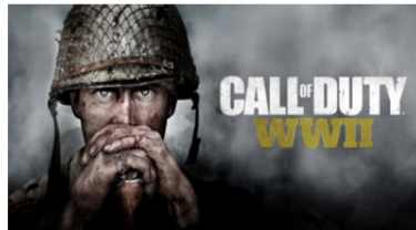
تصویر ۲. بازی رایانه‌ای ندای وظیفه www.activision.com call of duty world at warIII)