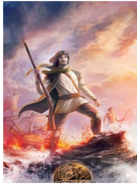
تصویر ۱. بازی رایانه‌ای میرمهنا

شرکت بازی‌سازی اسپریس پویانما با مشارکت بنیاد ملی بازی‌های رایانه‌ای در سال ۱۳۹۰ بازی را منتشر کرده‌اند. بازی در سبک اکشن اول شخص تاریخی بوده و هم‌چنین اولین بازی رایانه‌ای ملی است. این «بازی با داستانی برگرفته از کتاب بر جاده‌های آبی سرخ، براساس دلیر مردی‌های میرمهنا جنگویی در دوره‌ی کریم‌خان زند ساخته شده، که بر ضد استعمار هلند و انگلستان می‌جنگیده است» (اقدسی و همکاران ۱۳۹۱: ۹۳).