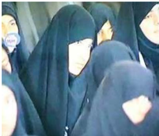
تصویر شماره ۲۳- برنامه درسهایی از قرآن سال ۱۳۷۷

و- ترکیبهای تصویری: تیتراژ ابتدایی حاوی ترکیبهای تصویری متعددی است که تا حدودی توانسته خیال انگیزی لازم را برای مخاطبان فراهم آورد.