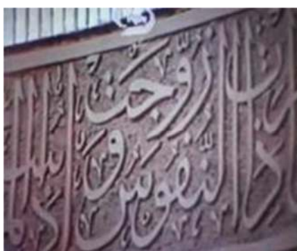
تصویر شماره ۸- برنامه درسهایی از قرآن سال ۱۳۶۶

در این مجموعه سه تصویر غیر از تصاویر گوینده و مخاطبان نشان داده شد. یکی از معدود تصاویر متفاوت، تصویر کتیبه‌ای است که بر دیوار مسجد است و دورترین با حرکت کلوزآپ تلاش دارد فاصله نزدیکی بین مخاطب با این کتیبه دینی ایجاد کند (تصویر شماره ۸).