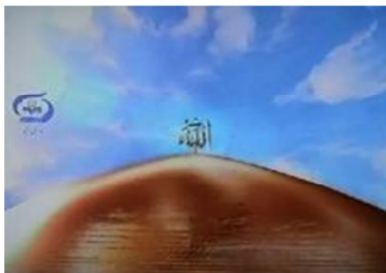
تصویر شماره ۲۴- برنامه درسهایی از قرآن سال ۱۳۸۱

ب- تحلیل نشانه‌شناختی: به لحاظ نشانه‌ای چند تغییر اصلی پدید آمده است. اول آنکه تیتراژ ابتدایی تغییر یافته و انیمیشن دیگری جایگزین قبلی شده است. در این انیمیشن که همراه با همان صوت قرآن هست، ابتدا تصویر از پایین به بالای گنبدی طلایی از میان نور آشکار می‌شود که در بالای آن کلمه «الله» نصب شده است تا همراه صوت قرآن این معنا را برساند که پیامی از جانب خدا به بندگان در پایین نازل شده است (تصویر شماره ۲۴). تصویر پایین به بالا حاکی از قدرت برتر خداوند است. گنبد نمادی از مسجد و آن نیز تمثیلی از عبادت خداوند است و به نوعی تأیید گزاره قبلی است که عبادت خداوند برتر را اساس قرار داده است. نور نیز تمثیلی از خداوند و رنگ آبی آسمان در زمینه، تداعی‌گر پیام آسمانی است.