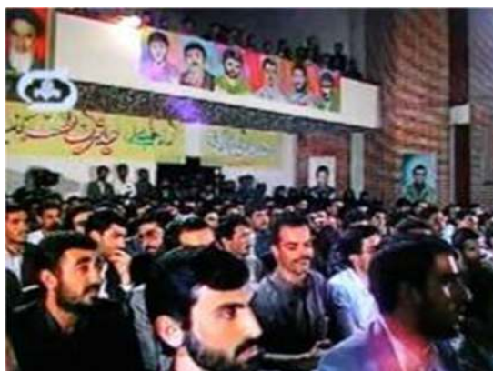
تصویر شماره ۱۵- برنامه درسهایی از قرآن سال ۱۳۶۹

تابلوهای شهدا که در رنگهای مختلف بر دیوار نصب شده، جذابیت رنگی تصویر را افزایش داده است (تصویر شماره ۱۵).