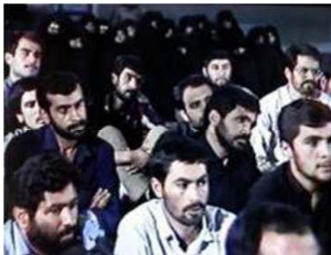
تصویر شماره ۱۱- برنامه درسهایی از قرآن سال ۱۳۶۶

ثالثاً تنوع تپیی در مخاطبان کاهش داشته و اکثر افراد از تپ مذهبیه هستند که این مسأله به طور طبیعی منجر به محدود کردن مخاطبان برنامه می‌شود. در واقع نکته مثبت برنامه گذشته ادامه پیدا نکرده و در نتیجه ابعاد جذب مخاطب آن تضعیف گشته است. علاوه بر این، لباس و سر و صورت نامنظم گوینده (به نسبت برنامه گذشته)، این وضع را تشدید کرده و در نهایت زیبایی تصویر را کاهش داده است.