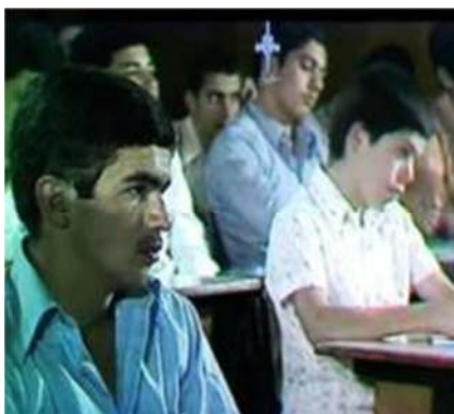
تصویر شماره ۵- برنامه درسهایی از قرآن سال ۱۳۵۸

نکته سوم که جالب هم به نظر می‌رسد، لباس جوانان است که بعضی از آنها با آستین کوتاه یا یقه باز در کلاس حضور دارند و نشان از تنوع تیپ مخاطب دارد (تصویر شماره ۵)، مسأله‌ای که در سالهای بعد دچار خدشه جدی شد. این تنوع تیپ جوانان، موجب جلب توجه و جذب تپهای متفاوت‌تری از مخاطبان به برنامه می‌شود و لذا نکته مثبتی به حساب می‌آید.