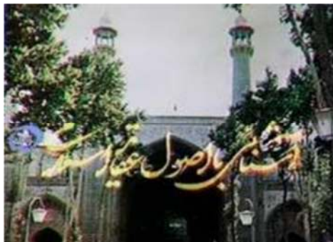
تصویر شماره ۱- برنامه درسهایی از قرآن سال ۱۳۵۸

ب- تحلیل نشانه‌شناختی: در ابتدای شروع برنامه، تصویر ثابت و بدون حرکتی از سر در یک مسجد که دور آن هم درختانی قرار گرفته است، نشان داده می‌شود و سپس همراه با آوایی دینی که همراه این تصویر پخش می‌شود، عبارت «آشنایی با اصول عقاید اسلامی» ظاهر می‌شود تا فضای دینی برنامه را منعکس کند (تصویر شماره ۱).