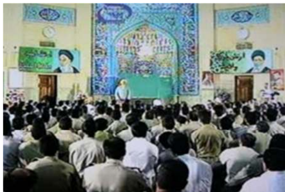
تصویر شماره ۲۰- برنامه درسهایی از قرآن سال ۱۳۷۷

یکی دیگر از نشانه‌ها در این دو برنامه بزرگتر شدن تصویر امام خمینی و مقام رهبری است که در دو طرف مسجد قرار گرفته است (تصویر شماره ۲۰)، گویی شدت و ابعاد ایدئولوژیک شدن دینی که می‌خواهد ارائه شود، بیشتر و بزرگتر گردیده است.