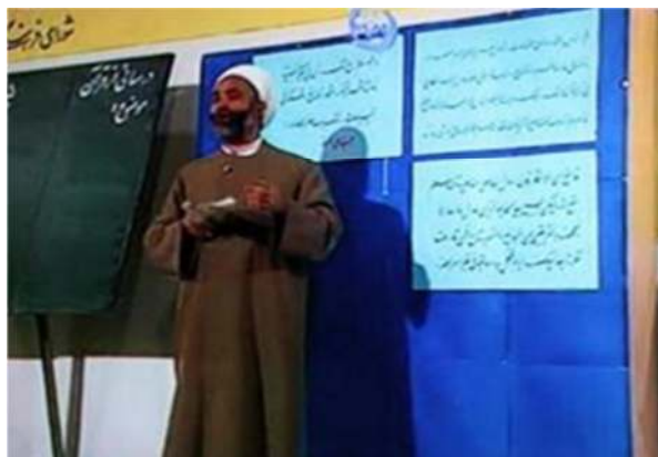
تصویر شماره ۱۶- برنامه درسهایی از قرآن سال ۱۳۶۹

ه- لباس، جنسیت و سن: از لحاظ لباس، فرق عمده‌ای که این برنامه نسبت به برنامه‌های قبلی دارد، نوع پوشش گوینده است که برخلاف قبل، لباس‌های منظم (قبا) پوشیده و محاسن هم تا حدودی مرتب گردیده که این امر زیبایی تصویر را افزوده است (تصویر شماره ۱۶). از لحاظ سن مخاطبان تغییر عمده‌ای مشاهده نمی‌شود و عمدتاً جوانان حضور دارند. به لحاظ جنسیت، در این برنامه زنان نیز حضور دارند و از جهت نشستن نیز تقریباً موازی آنان (در کنار مردان ولی کمی عقب‌تر) قرار دارند، اما تصاویر بسیار کم (یک یا دو تصویر) و عمدتاً در نمای دور از آنان وجود دارد. این امر نشان دهنده آن است که اگرچه جایگاه آنها در جامعه تا حدودی تغییر کرده، اما همچنان آنها نادیده گرفته می‌شوند. تنوع تیپ و لباس مخاطبان نسبت به برنامه قبلی بیشتر شده و طیف بیشتری از مخاطبان را دربرمی‌گیرد، اگرچه از این لحاظ، به برنامه ابتدای انقلاب (برنامه سال ۱۳۵۸) نمی‌رسد. اما در مورد زنان این تفاوت تیپ وجود ندارد و اکثراً زنان چادری هستند. و- ترکیبهای تصویری: در این مجموعه همچنان از ترکیبهای تصویری استفاده نشده است و در نتیجه فرصتی را برای خیال‌انگیزی فراهم نمی‌کند. ز- تحلیل نهایی: در مجموع به نظر می‌رسد با توجه به اتمام جنگ و آغاز دهه دوم انقلاب اسلامی و رهبری جدید، فضای نوینی در کشور ایجاد شده که این امر به برنامه‌های دینی نیز تسری یافته است. تغییرات قابل توجه شامل تنوع تیپ و پوشش مخاطبان، آراسته شدن گوینده، تنوع رنگی بیشتر در تصویر و در نهایت توجه بیشتر به حرکت تصویری است. در واقع شاهد اهمیت یافتن تدریجی کیفیت تصویر در برنامه‌های دینی هستیم.