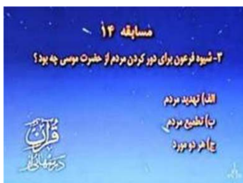
تصویر شماره ۳۰- برنامه درسهایی از قرآن سال ۱۳۸۱

در انتهای برنامه نیز مسابقه‌ای از مطالب بیان شده پخش می‌گردد که در آن سؤالاتی سه گزینه‌ای مطرح شده و از بینندگان خواسته می‌شود که گزینه‌های درست را به آدرس پستی ارسال کنند (تصویر شماره ۳۰)