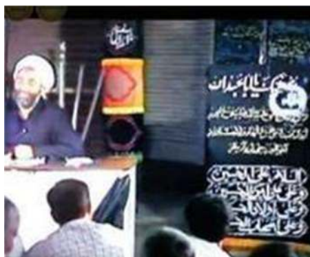
تصویر شماره ۹- برنامه درسهایی از قرآن سال ۱۳۶۶

همچنین تصویر پارچه سیاهی که بر روی آن قسمتی از «زیارت عاشورا» آمده در نمایی متوسط نشان داده می‌شود تا مخاطب بتواند با توجه به مطالبی که می‌شنود، رابطه فردی با آن زیارت برقرار سازد (تصویر شماره ۹). دقایقی بعد نیز، حرکت تصویر بر روی پارچه‌ای است که جمله‌ای از امام خمینی در مورد حادثه کربلا بر روی آن نوشته شده است تا بار دیگر معانی بیان شده توسط گوینده به گونه‌ای دیگر تجلی یابد.