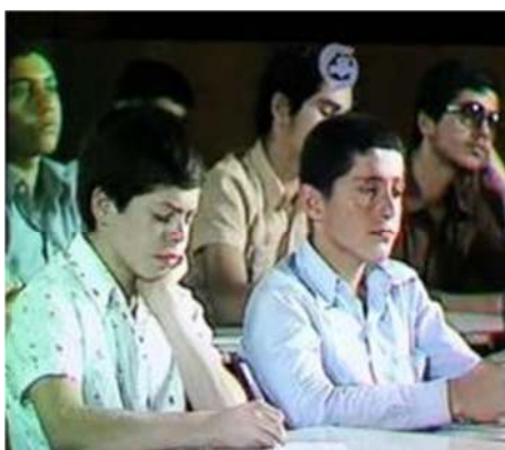
تصویر شماره ۴- برنامه درسهایی از قرآن سال ۱۳۵۸

در طول برنامه، دو یا سه بار تصویرکلوزآپ مخاطبان نشان داده می‌شود که یا با دقت در حال گوش دادن به گوینده هستند و یا در حال یادداشت‌برداری از صحبت‌های او (تصویر شماره ۴) و از این طریق تلاش شده یک نوع نزدیکی با شنوندگان حاضر را به بیننده تلویزیونی منتقل کند تا آنها هم دقت و یادداشت‌برداری را بیاموزند.