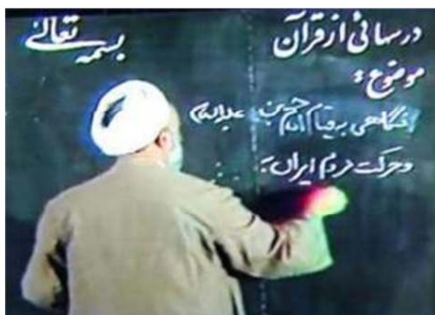
تصویر شماره ۱۲- برنامه درسهایی از قرآن سال ۱۳۷۰

هیچ عبارتی از قبل وجود نداشت، عبارت «بسمه تعالی» و «درسهایی از قرآن» با خط زیبایی نستعلیق نوشته شده که این امر، علاوه بر افزایش زیبایی بصری تصویر، فضا سازی نسبتاً مناسبی را به لحاظ کلیت نوع برنامه و مطالبی که می‌خواهد عرضه شود، فراهم می‌کند (تصویر شماره ۱۲).