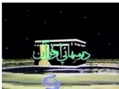
تصویر شماره ۱۹- درسهایی از قرآن سال ۱۳۷۵

این تصاویر همراه با تلاوت قرآن نشانه آن است که نزول آیات قرآن به زمین و این کره خاکی از غار حرا آغاز شد و سپس نوای آن تمام جهان و کهکشان را دربرگرفت تا جایی که کعبه به عنوان خانه خدا در مرکز این عالم قرار گرفت. اکنون قرار است درسهایی از این قرآن که به واسطه قرار گرفتن این عبارت بر روی تصویر کعبه، نمادی از خانه کلمات الهی به حساب می‌آید، برای مخاطبان عرضه شود. در واقع تیتراژ ابتدایی به واسطه واقعیت مجازی که ایجاد کرده، توانسته خیال‌انگیزی مخاطب را تا حدودی فعال کرده و در کنار نشانه‌های معنادار که در این تیتراژ بکار رفته، فضای مناسب برای ورود به مباحث را فراهم کند.