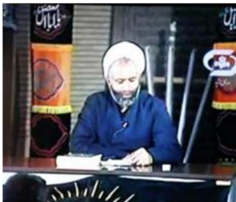
تصویر شماره ۷- برنامه درسهایی از قرآن سال ۱۳۶۶

نمادی از اشعه‌های خورشید باشد و این معنا را (هرچند ضعیف) برساند که این جلسه دینی همچون خورشید می‌درخشد (تصویر شماره ۷).