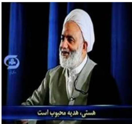
تصویر شماره ۲۹- برنامه درسهایی از قرآن سال ۱۳۸۱

در انتهای برنامه نیز مسابقه‌ای از مطالب بیان شده پخش می‌گردد که در آن سؤالاتی سه گزینه‌ای مطرح شده و از بینندگان خواسته می‌شود که گزینه‌های درست را به آدرس پستی ارسال کنند (تصویر شماره ۳۰)