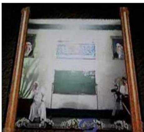
تصویر شماره ۳۴- برنامه درسهایی از قرآن سال ۱۳۸۲

و- ترکیبهای تصویری: یکی از ترکیبهای تصویری در این برنامه، استفاده از نامه در ابتدای شروع برنامه است. در صحنه شروع برنامه، «نامه»ای همچون نامه‌های قدیمی از دو سو باز می‌شود و سخنران را در میانه آن نشان می‌دهد. گویی پیامی که سخنران می‌خواهد برای مخاطب بیان کند، همچون نامه‌ای است که این برنامه تلویزیونی در حال بازخوانی آن است (تصویر شماره ۳۴) در واقع تصویرساز با ترکیب تصویری ساده، تنوع تصویری را بالا برده و به جذابیت آن در جهت خیال‌انگیزی افزوده است. علاوه بر این، زیرنویس در طول پخش برنامه نوعی ترکیب تصویری به حساب می‌آید که جذابیت تصویر را افزایش می‌دهد.