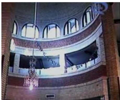
تصویر شماره ۱۰- برنامه درسهایی از قرآن سال ۱۳۶۶

تصویر سوم نیز، تصویری از سقف قوسی شکل داخل مسجد است که لوستری در میانه آن آویزان گردیده، تا علاوه بر اینکه تداعی‌گر معماری اسلامی و فضای مذهبی مرتبط با آن باشد، نمادی از صحبت‌های گوینده باشد که همچون چراغی در مسجد، معارف دینی را بازمی‌گوید. این تلقی با حرکت از چراغ و لوستر از سمت بالا به پایین که جمعیت مستمع را نشان می‌دهد، تثبیت می‌شود (تصویر شماره ۱۰).