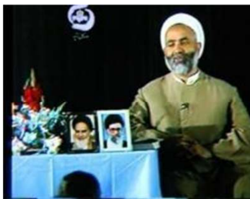
تصویر شماره ۱۴- برنامه درسهایی از قرآن سال ۱۳۷۰

در برنامه ۱۳۷۰، یکی از تغییرات مهم به وجود آمده در تصویر، قرار گرفتن عکسهای امام خمینی و مقام رهبری بر روی میز و در کنار گوینده و به سمت دوربین است که این تلقی را ایجاد می‌کند که سخنان دینی گوینده از جانب نظام سیاسی در حال بیان است (تصویر شماره ۱۴). به بیان دیگر، سخنان دینی گوینده بر خلاف گذشته که بدون پیش زمینه، از طریق تصویر تلویزیونی مطرح می‌شد، با ایدئولوژی نظام سیاسی تلفیق شده و در قالب ایدئولوژی نظام مطرح می‌شود. آفت شکل دادن به چنین فرآیندی این است که نقص و اشکال نظام دینی به حساب نقص و اشکال دین گذاشته شده و به نوعی به آن تسری می‌یابد.