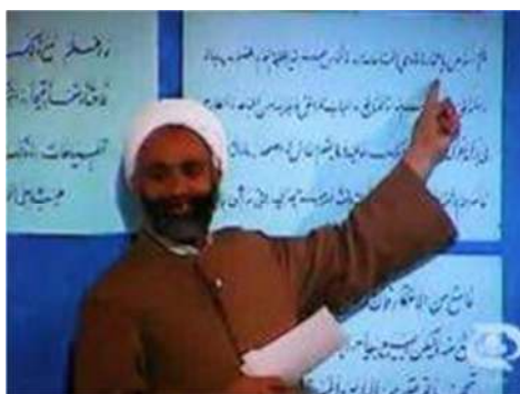
تصویر شماره ۱۳- برنامه درسهایی از قرآن سال ۱۳۶۹

علاوه بر این، در برنامه سال ۱۳۶۹، احادیثی که بناست در آن جلسه بر روی آن بحث شود، از قبل در روی مقوا و در کنار تخته، بر روی تابلوی دیگری چسبانده شده تا از این طریق هم جذابیت تصویری به لحاظ خط نستعلیق بکار رفته، افزایش یابد و هم به لحاظ بصری، امکان ارتباط بیشتر مخاطب را با مطالب فراهم کند. ضمن آنکه مقواها بر روی رنگ زمینه‌ای متفاوت چسبانده شده که جذابیت را افزوده است (تصویر شماره ۱۳).