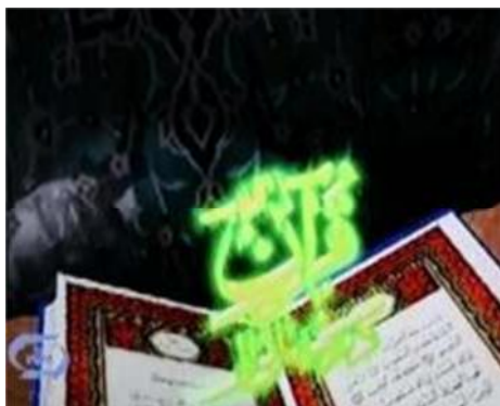
تصویر شماره ۲۷- برنامه درسهایی از قرآن سال ۱۳۸۱

دومین تغییر که حائز اهمیت است، درگیر کردن مخاطب تلویزیونی با برنامه است که با چند روش انجام گرفته است. ابتدا پس از پایان تیتراژ، اهم مطالبی که قرار است در آن جلسه توسط سخنران بیان شود، در قالب سؤالاتی در صفحه تصویر تلویزیونی آشکار گردیده و گوینده‌ای آن را مرور می‌کند (تصویر شماره ۲۸).