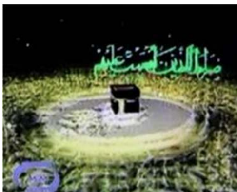
تصویر شماره ۱۸- درسهایی از قرآن ۱۳۷۵

صفحه و بر روی کعبه آشکار می‌گردد و سپس برنامه با ذکر صلواتی آغاز می‌گردد (تصویر شماره ۱۹).