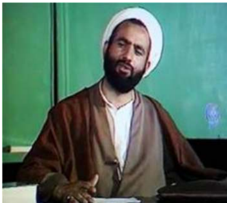
تصویر شماره ۶- برنامه درسهایی از قرآن سال ۱۳۵۸

و- ترکیبهای تصویری: در این مجموعه از ترکیبهای تصویری استفاده نشده است و در نتیجه فرصتی را برای خیال انگیزی فراهم نمی‌کند. تنها برای نوشتن عنوان برنامه و نام گوینده، کلماتی در وسط تصویر قرار می‌گیرد و به غیر از این دو مورد، چیزی مشاهده نمی‌شود.