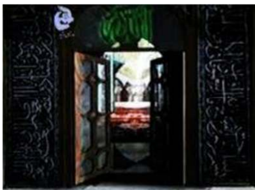
تصویر شماره ۲۵- برنامه درسهایی از قرآن سال ۱۳۸۱