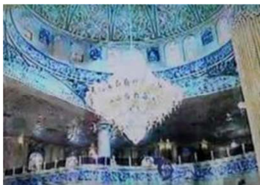
تصویر شماره ۲۱- برنامه درسهایی از قرآن سال ۱۳۷۷

به جز این موارد، بازگشت دوباره کتیبه‌ها و طاق قوسی مسجد است که در تصاویر بکار رفته و از این طریق تلاش شده که فضای نشانه‌ای دینی را فراهم کند. دقیقاً مشابه برنامه سال ۱۳۶۶، تصویر از سقف مملو از نگاره‌های متعدد معماری اسلامی آغاز گشته و با حرکت به پایین دوربین و نشان دادن لوستر و چراغ و در نهایت جمعیت، مطالب ارائه شده را همچون نوری در بین جمعیت معرفی می‌نماید (تصویر شماره ۲۱). قرائت قرآن با لحن بسیار زیبا در تیتراژ ابتدایی، به زیبایی تصویر افزوده و فضاسازی مناسبی را نیز برای برنامه مهیا نموده است.