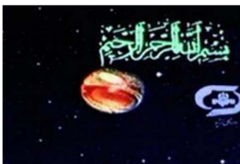
تصویر شماره ۱۷- درس‌هایی از قرآن سال ۱۳۷۵

ب- تحلیل نشانه شناختی: در این تیتراژ که به صورت کامپیوتری و انیمیشنی تهیه شده، همراه با تلاوت سوره حمد توسط قاری برجسته عبدالباسط، ابتدا تصویر کره زمین را در حال چرخش در میانه آسمان نشان می‌دهد که از فاصله دور به جلوی تصویر می‌آید (تصویر شماره ۱۷).