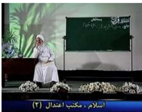
تصویر شماره ۳۲- برنامه درسهایی از قرآن سال ۱۳۸۲

ج- رنگ و نور: به دلیل آنکه جلسات در داخل سالن برگزار می‌شود، دیگر مشکلات نورپردازی بسیار کمتر شده است و لذا پس از سالها شاهد نورپردازی نسبتاً مطلوب در این برنامه هستیم. در برنامه سال ۱۳۸۲ شاهد استفاده از نورپردازی در پشت سر سخنران با استفاده از رنگ سبز هستیم که تصویر درختی را ایجاد کرده و به زیبایی بیشتر تصویر انجامیده است. (تصویر شماره ۳۲). در سال ۱۳۸۱ هم پرده آبی رنگ پشت سر گوینده، وزانت و نظم را به تصویر افزوده است (تصویر شماره ۳۱).