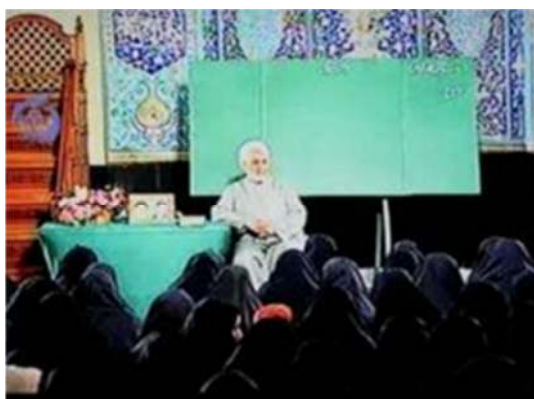
تصویر شماره ۲۲- درسهایی از قرآن ۱۳۷۷

ه- لباس، جنسیت و سن: مهمترین تغییری که در برنامه سال ۱۳۷۷ اتفاق افتاده، حضور بانوان به طور کامل در جلوی گوینده و در فاصله نسبتاً کم با او است، در حالیکه تعداد کمی از آقایان در گوشه‌ها یا پشت خانمها نشسته‌اند. این برنامه که به مناسبت میلاد حضرت زهرا (س) و روز زن تولید گشته، نشان از بازگشت زنان به سطح اول جامعه و دیده شدن آنهاست (تصویر شماره ۲۲).