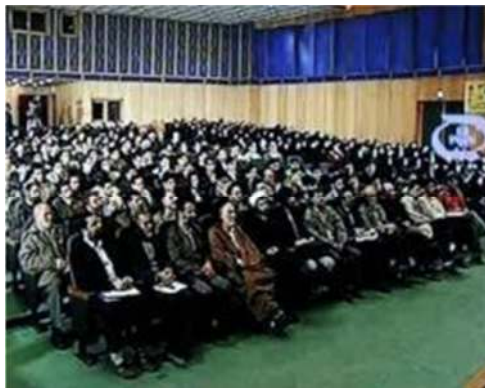
تصویر شماره ۳۳- برنامه درسهایی از قرآن سال ۱۳۸۱

و- ترکیبهای تصویری: یکی از ترکیبهای تصویری در این برنامه، استفاده از نامه در ابتدای شروع برنامه است. در صحنه شروع برنامه، «نامه»ای همچون نامه‌های قدیمی از دو سو باز می‌شود و سخنران را در میانه آن نشان می‌دهد. گویی پیامی که سخنران می‌خواهد برای مخاطب بیان کند، همچون نامه‌ای است که این برنامه تلویزیونی در حال بازخوانی آن است (تصویر شماره ۳۴) در واقع تصویرساز با ترکیب تصویری ساده، تنوع تصویری را بالا برده و به جذابیت آن در جهت خیال‌انگیزی افزوده است. علاوه بر این، زیرنویس در طول پخش برنامه نوعی ترکیب تصویری به حساب می‌آید که جذابیت تصویر را افزایش می‌دهد.