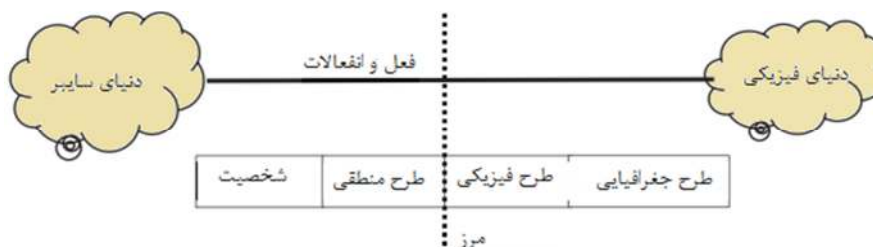
نمودار شماره ۲: مرز بین دنیای واقعی و فضای سایبر

شخصیت سایبر به معنای هویت در این دنیای مجازی است که می‌تواند در برگیرنده گروهی از مردمف یک مشاین، یک سیستم مستقل، یک نرم افزار یا یک هویت فردی ناشناس باشد. طرح منطقی در برگیرنده نرم افزار، سیستم عامل، برنامه و هرگونه سیستم منطقی می‌باشد. لایه فیزیکی در برگیرنده زیرساخت‌های اطلاعاتی است که یکی از ستون‌های اصلی دنیای سایبر محسوب می‌گردد و می‌تواند در برگیرنده سخت افزارها، سوئیچ یا برق باشد. طرح جغرافیایی نیز به عنوان موقعیتی که در دنیای واقعی تحت تأثیر عملیات‌های موجود در فضای مجازی قرار دارد شناخته می‌شود. این دو فضا دارای تعاملاتی با یکدیگر هستند و به صورت تأثیرگذار و تأثیرپذیر عمل می‌نمایند. هنگامی که این تعامل بین دنیای فیزیکی و فضای مجازی در حال شکلگیری است مجموعه‌ای از اطلاعات پدید می‌آید که دنیای فیزیکی را به دنیای مجازی گره می‌زند (Azami, 2019: 22). بنابراین می‌توان مشاهده نمود که ما در جهان امروز با دنیایی دیگر مواجه هستیم که از ویژگی‌ها و شرایط منحصر به فردی برخوردار می‌باشد که باید تمامی ابعاد زندگی خود را متناسب با این شرایط تدوین نماییم.