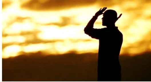
تصویر ۵. نمازخواندن برادی با پس‌زمینه‌ای از یک غروب دل‌گیر (S3/E11/11: 20).