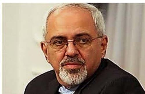
تصویر ۳. دکتر محمدجواد ظریف، وزیر امور خارجه ایران از سال ۲۰۱۳

جواد از دیگر شخصیت‌های ایرانی، مسلمان، و منفی سریال است که ریش پروفیسوری دارد و سابقاً ارتباطات سیاسی با ایالات متحده و سازمان سیا داشته است و در نهایت برای آزاد کردن دارایی‌های مالی خود تلاش می‌کند.