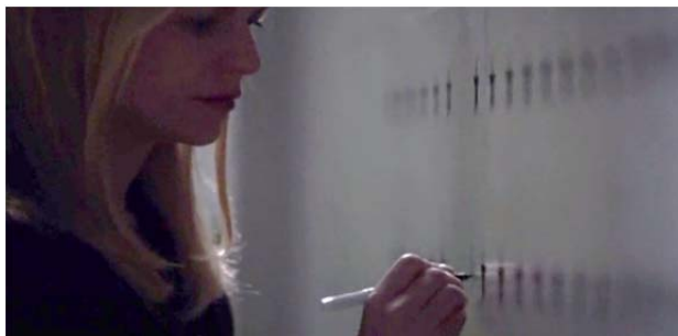
تصویر ۱۱. کری ستاره‌ای نمادین برای یادبود برادی به ستاره‌ها اضافه می‌کند (S3/E12/57: 15).