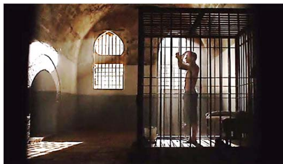
تصویر ۶. برادی در آرامش تمام در زندانی در ایران خودش را می‌شوید (S3/E12/29: 46).

یکی دیگر از سکانس‌های تأثیرگذار فصل سوم زمانی است که برادی خودش را در سلولش می‌شوید (مشخص نیست در حال غسل کردن است یا فقط نظافتی معمولی). چیزی که مخاطب در این سکانس شاهد آن است زندانی‌ای است که خودش را در سلولی درون زندان می‌شوید (تصویر ۶). با توجه به طراحی صحنه، می‌توان گفت این سکانس واقعاً پرمعناست. تصویر جلو یا پیش‌زمینه (foreground) میله‌های زندان را نشان می‌دهد و در پس‌زمینه (background) دو پنجره را می‌بینیم که شبیه دو مناره یا گنبد هستند. در سمت چپ صحنه، محرابی وجود دارد و در مرکز یک آمریکایی مسلمان قرار گرفته است. این صحنه درحقیقت پر است از میله‌های زندان و پنجره‌ها؛ بنابراین، ترکیب میله‌های زندان، محراب، گنبد، و یک مسلمان ترکیب چندلایه‌ای است که در آن همه آن‌ها با هم یکی می‌شوند تا تصویر اسارت و زندانی‌بودن، محدودیت، و درنهایت مرگ را القا کنند که همگی با اسلام مرتبط می‌شوند. به عبارت دیگر، محراب و گنبد در این جا دال‌هایی برای مدلولی به نام اسلام هستند (S3/E12/29: 46).