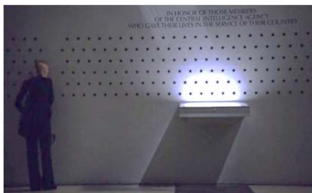
تصویر ۱۰. ستاره هایی که به افتخار اعضای از دست رفته سازمان سیا کشیده می شوند (S3/E12/57: 10).

یکی از مهم ترین و البته زیرپوستی ترین پیغام هایی که سریال هوم لند در تلاش است به مخاطب خود انتقال بدهد تقسیم بندی مقاصد شخصیت هایش است. همه افرادی که در فکر انتقام وحشیانه و ایجاد وحشت و ترور هستند در نهایت به مرگ و سرنوشتی تلخ دچار می شوند. این ایدئولوژی هم در مورد شخصیت های غربی مانند ویلیام والدن (William Walden)، معاون اول رئیس جمهور آمریکا، و دیوید ایستس (David Estes)، مدیر سازمان سیا، و هم درباره مسلمانانی هم چون ابونظیر، تام واکر (Tom Walker)، دانش اکبری، و ... به کار می رود. البته خود برادی مورد استثنای فیلم است. طبق خط داستانی فیلم، کری عاشق برادی بود و فصل سوم در حالی به پایان می رسد که او بچه برادی را باردار است و در سکانس آخر اپیزود آخر کری با اضافه کردن ستاره ای دیگر به صدها ستاره ای که بر روی دیواری در سازمان سیا کشیده شده اند، به طور نمادین و طبق تحلیلی نشانه شناسانه، می خواهد نشان بدهد که برادی و یاد و خاطره اش همواره زنده خواهد بود (تصاویر ۱۰ و ۱۱).