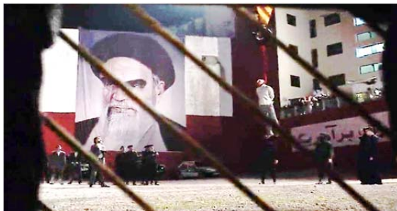
تصویر ۷. لانگ‌شاتی که در پس‌زمینه‌اش تصویر امام خمینی دیده می‌شود (S3/E12/37: 50).

بعد از مدتی، در اپیزود دوازدهم فصل سوم، اعدام برادی در جایی اتفاق می‌افتد که پرتره بزرگی از آیت‌الله خمینی بر دیوار آویزان است (تصویر ۷). برادی دو سه‌بار در لانگ‌شات (long shot) با تصویر پرتره در پس‌زمینه نشان داده می‌شود. یکی از کارکردهای لانگ‌شات در سینما و تلویزیون نشان‌دادن همه افراد، اشیا، و فرایندهای موجود در صحنه به صورت یک کل است که به این ترتیب به مخاطب این اجازه را می‌دهد که تمام اتفاقاتی را که در حال وقوع است در یک تصویر درشت دنبال کند. بنابراین، مخاطب با دیدن این صحنه در لانگ‌شات ناخودآگاه می‌تواند به این نتیجه برسد که خمینی تاحدی مسئول کل آن اتفاق غم‌انگیز و سرنوشت تلخ برادی است.