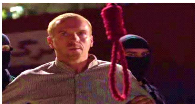
تصویر ۱. برادی با طنابی که هم‌رنگ جانمازی است که سابقاً بر رویش نماز می‌خواند اعدام می‌شود (S3/E12/36: 12).

مخاطبان شاهد آن جانماز یا فرش قرمزی هستند که برادی مدام از آن برای نماز خواندن در فصل اول و دوم استفاده کرده بود. رنگ آن طناب به‌طور ناخودآگاه جانماز قرمز برادی را به یاد مخاطب می‌آورد. به بیانی دیگر، رنگ قرمز در این‌جا نقش دالی را بازی می‌کند که مدلولش مفهومی هم‌چون «نماز خواندن»، «اسلام»، و «داشتن تفکری اسلامی» است.