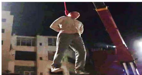
تصویر ۹. اعدام برادی که با زاویه از پایین به بالا فیلم برداری شده است (S3/E12/31: 10).

در این جا برادی به طور فیزیکی اعدام می شود، اما از نظر نشانه شناسی طوری نشان داده می شود که گویی در حال عروج و بالارفتن و پشت سر گذاشتن همه سختی هاست و آخرین قدم هایش را برمی دارد تا برای آمریکایی ها به قهرمان تبدیل شود.