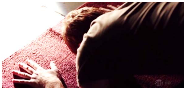
تصویر ۲. فرش قرمزی که برادی در خانه خودش روی آن نماز می‌خواند (S1/E3/15: 23).