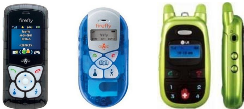
شکل ۲. گوشی‌های تلفن همراه مخصوص کودکان

این گوشی‌ها از نظر اندازه، وزن، طرح، و تعداد دکمه‌ها ویژه کودکان طراحی شده است و امکان دسترسی آن‌ها به کمک‌های اضطراری را فراهم می‌کنند. والدین می‌توانند برای تعداد محدود دکمه‌های موجود برنامه‌ریزی کنند و با کودک خود در تماس باشند.