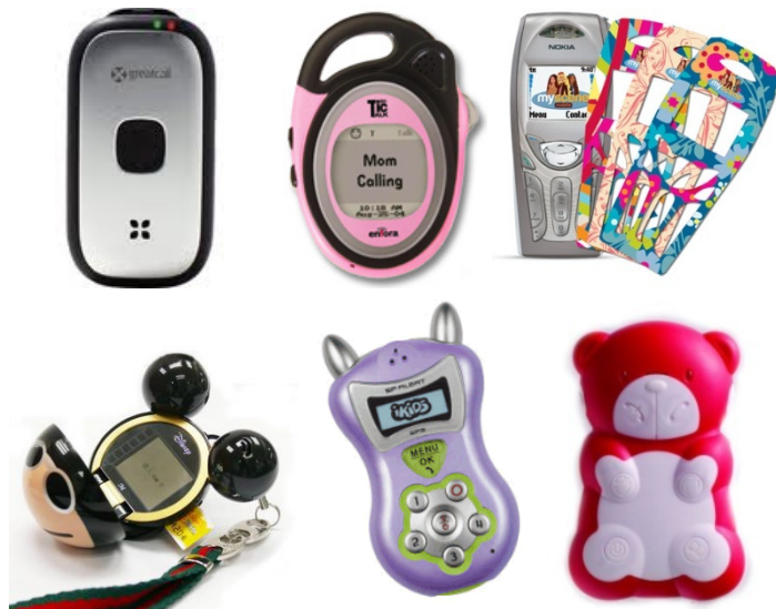
شکل ۳. انواع دیگر گوشی‌های تلفن همراه طراحی شده برای کودکان و نوجوانان

۲.۲.۴ تولید و عرضه گوشی‌های تلفن همراه مخصوص کودکان و نوجوانان در ایران راه‌حل دیگر در این زمینه تولید داخلی و عرضه گوشی‌های تلفن همراه مخصوص کودکان و نوجوانان است که ضمن سودآوری تجاری برای طراحان و صنعت‌گران ایرانی، ما را در فرایند بومی‌سازی تکنولوژیک یاری خواهد کرد. در این زمینه و با روش ایده‌پردازی پرسونا خواجه‌یویی نژاد (۱۳۸۶) به طراحی گوشی تلفن همراه مخصوص کودکان دبستانی اقدام کرده است. او بر اساس مشاهده و مصاحبه با معلمان مقطع ابتدایی، چند شخصیت مجازی به منزله شاخص‌های افراد گوناگون گروه هدف در نظر گرفت و پانزده ایده را پیش‌نهاد کرد. ارزیابی و آزمون این ایده‌های اولیه به طراحی یک ایده برتر بر اساس چهار محور امنیت، ارتباطات، سرگرمی، و آموزش منجر شده است.