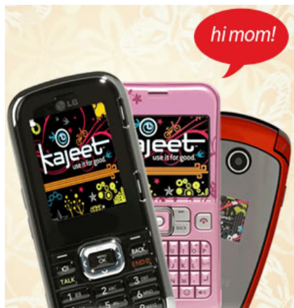
شکل ۱. گوشی‌های تلفن همراه کجیت (Kajeet) مخصوص نوجوانان

شرکت کجیت از سال ۲۰۰۳ منحصراً به تولید و عرضه طیف متنوعی از گوشی‌های تلفن همراه مخصوص کودکان و نوجوانان پرداخته است. ایده اولیه طراحی این گوشی‌ها از سوی سه پدر امریکایی مطرح شد که قصد داشتند امکان امنی برای دسترسی فرزندان‌شان